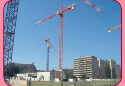
... et aujourd'hui

Les premières traces du domaine de la Buire dans l'histoire locale remontent à 1560 et à Noble Benoît de Monconys, Seigneur de la Buire. Bordée du domaine de la Part-Dieu au nord et de celui de la Mothe au sud, cette seigneurie subissait, comme ses voisins, les sautes d'humeur du Rhône et se trouvait fréquemment inondée. Elle se composait alors de terres agricoles, dominées par une maison forte : le château de la Buire. Cet édifice, une œuvre du XVI e siècle, comprenant une tourelle à six pans, a survécu jusqu'à nos jours (voir photo ci-dessous). Il se trouve à l'angle des rues Rachais et Garibaldi.