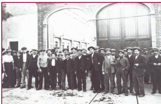
Les ouvriers du chantier de La Buire

Ces automobiles se distinguaient aussitôt dans les compétitions sportives, notamment dans les courses de côtes où elles firent preuve de