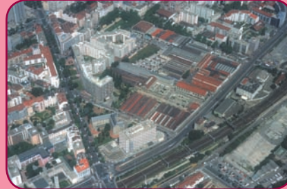
... 90 ans plus tard...