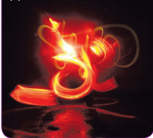
Light graff 3° oeil 2006

« J'adore faire plein de choses différentes », confie l'artiste, « tout en gardant un fil conduc-