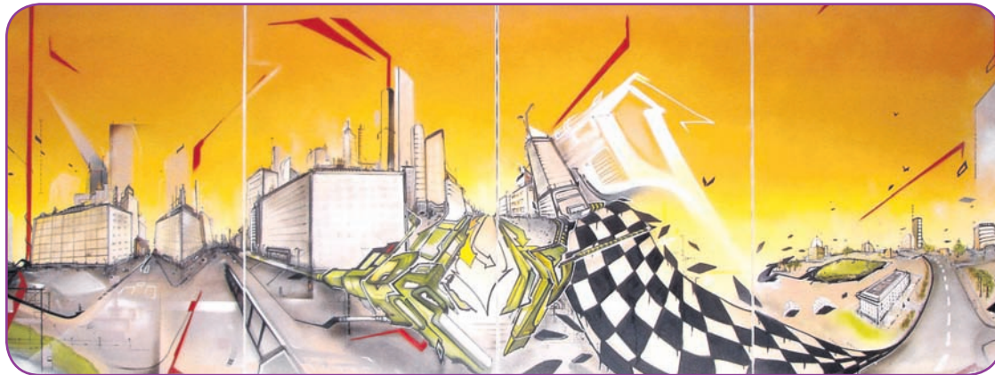
Commande Caisse des dépôts de Lyon 2006 80x130 x4 spray acrylique